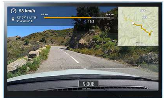
Tripmaster & voix du copilote