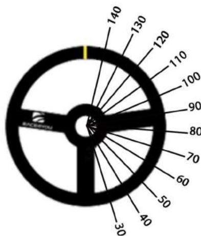
SYSTÈME EN ANGLES