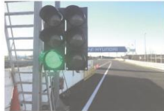
SEMÁFORO VERDE PISTA ABIERTA

Siga las instrucciones de los comisarios e incorpórese con precaución. No cruce la línea continua de incorporación a la pista. Si viene circulando por la recta tampoco debe cruzar dicha línea continua.