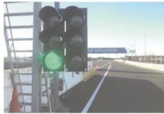
SEMÁFORO VERDE PISTA ABIERTA

Siga las instrucciones de los comisarios e incorpórese con precaución. No cruce la línea continua de incorporación a la pista. Si viene circulando por la recta tampoco debe cruzar dicha línea continua.