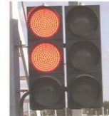
SEMÁFORO ROJO PISTA CERRADA NO SALIR